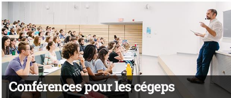
Conférences pour les cégeps