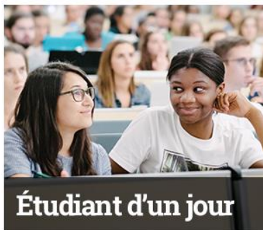
Étudiant d'un jour