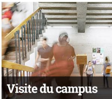
Visite du campus